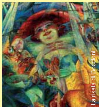
La risata di Boccioni